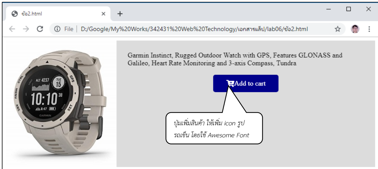
หน้าจอบน Desktop